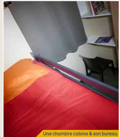
Une chambre cabine & son bureau