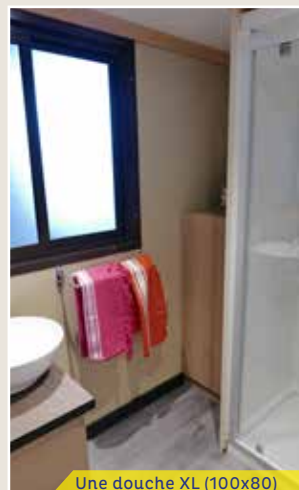
Une douche XL (100x80)