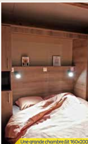
Une grande chambre (lit 160x200)