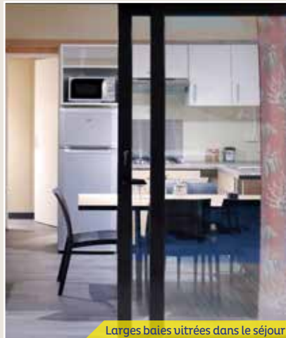
Larges baies vitrées dans le séjour