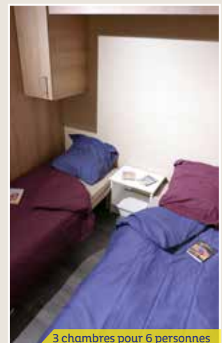
3 chambres pour 6 personnes