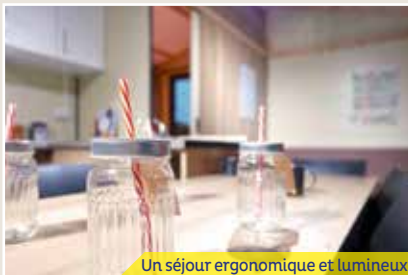
Un séjour ergonomique et lumineux