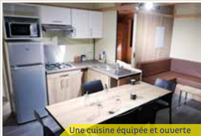
Une cuisine équipée et ouverte