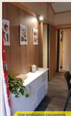
Une ambiance cocooning