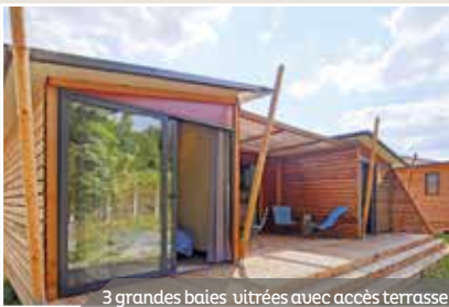
3 grandes baies vitrées avec accès terrasse