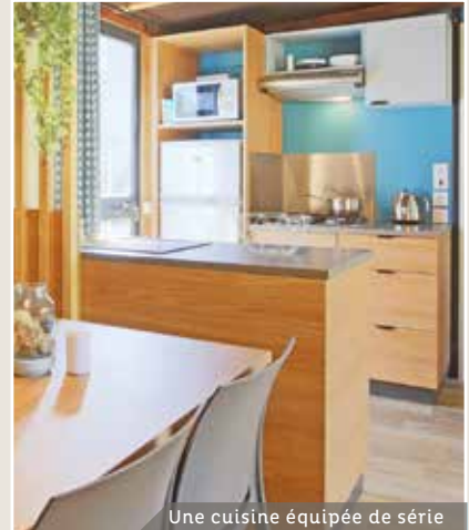
Une cuisine équipée de série