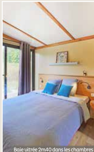
Baie vitrée 2m40 dans les chambres