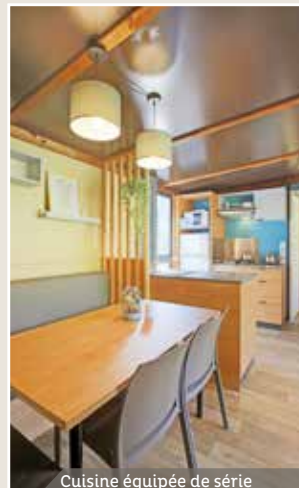
Cuisine équipée de série