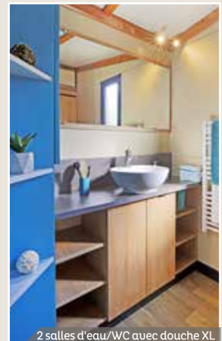
2 salles d'eau/WC avec douche XL