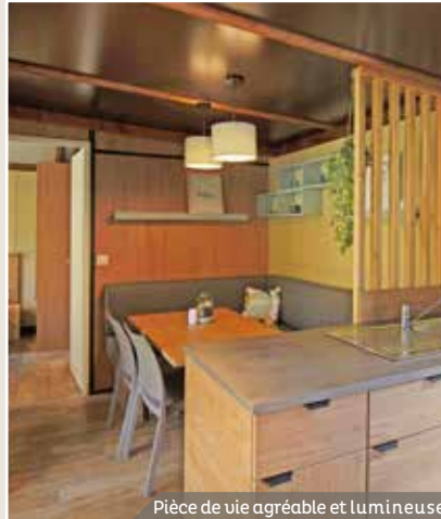
Pièce de vie agréable et lumineuse