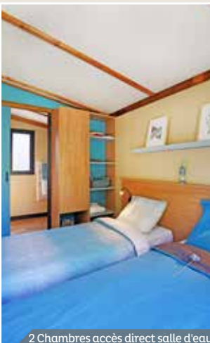
2 Chambres accès direct salle d'eau