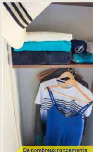
De nombreux rangements