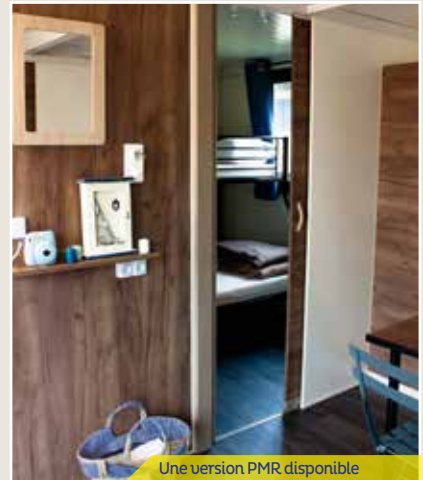
Une version PMR disponible