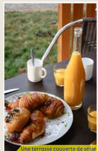
Une terrasse couverte de série