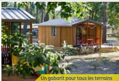
Un gabarit pour tous les terrains