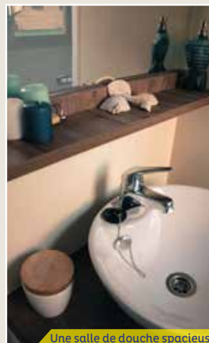
Une salle de douche spacieuse