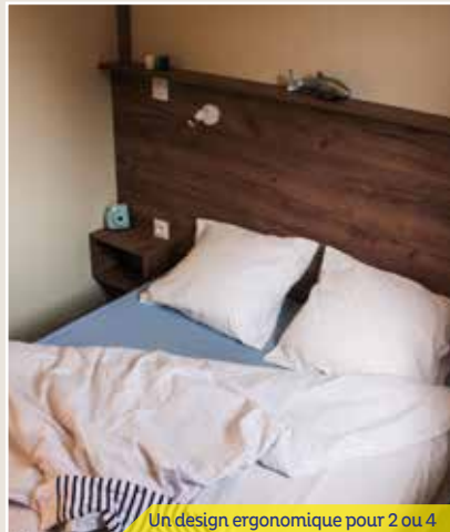
Un design ergonomique pour 2 ou 4