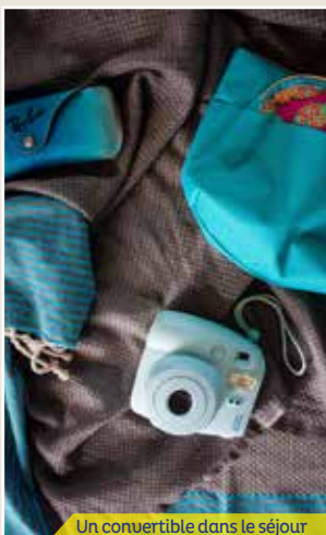
Un convertible dans le séjour