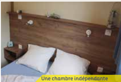
Une chambre indépendante