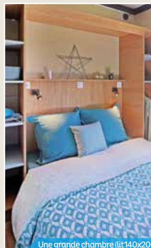
Une grande chambre (lit 140x200)