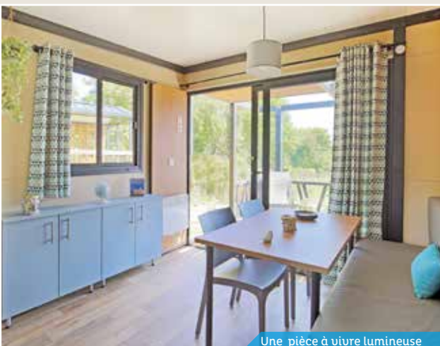
Une pièce à vivre lumineuse