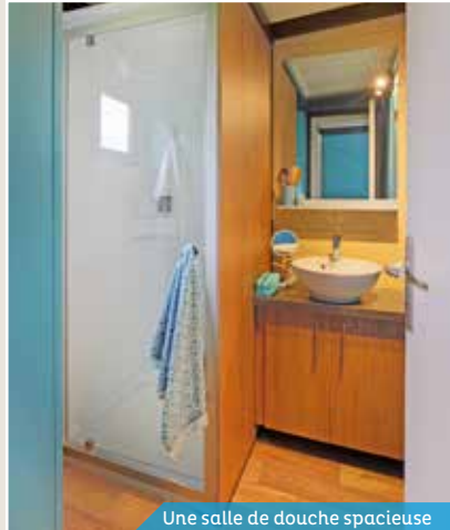
Une salle de douche spacieuse