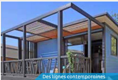
Des lignes contemporaines