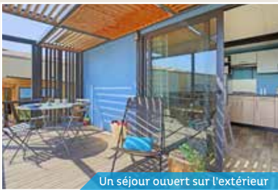
Un séjour ouvert sur l'extérieur