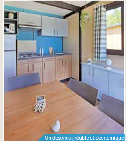
Un design agréable et économique