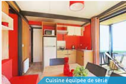
Cuisine équipée de série