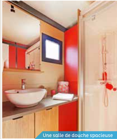
Une salle de douche spacieuse