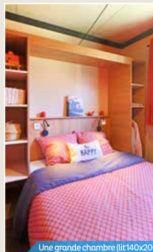
Une grande chambre (lit 140x200)