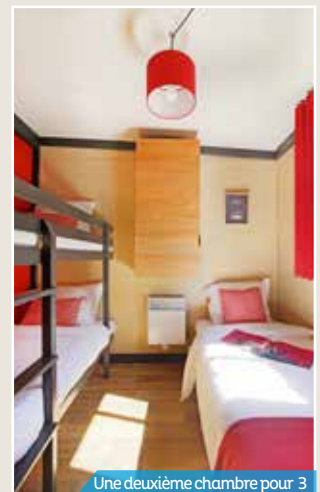
Une deuxième chambre pour 3