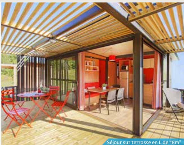
Séjour sur terrasse en L de 18m 2