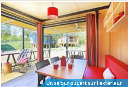
Un séjour ouvert sur l'extérieur