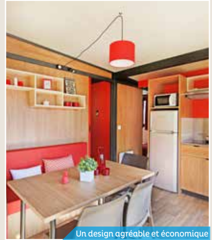
Un design agréable et économique