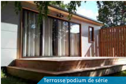
Terrasse podium de série