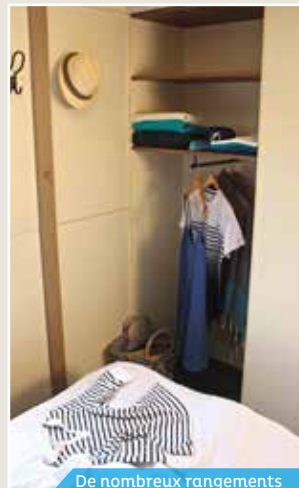
De nombreux rangements