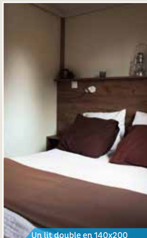
Un lit double en 140x200