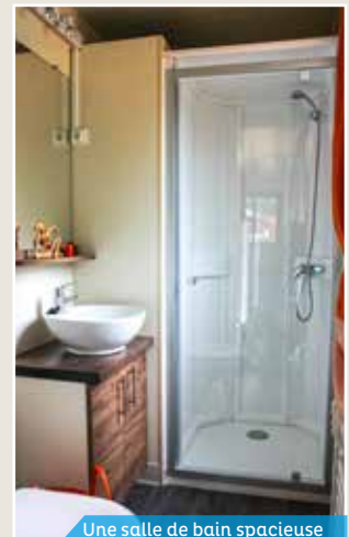
Une salle de bain spacieuse