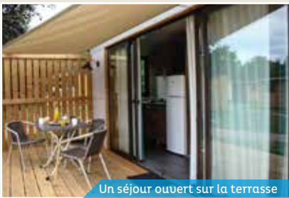
Un séjour ouvert sur la terrasse