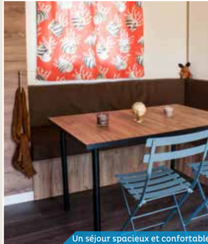
Un séjour spacieux et confortable