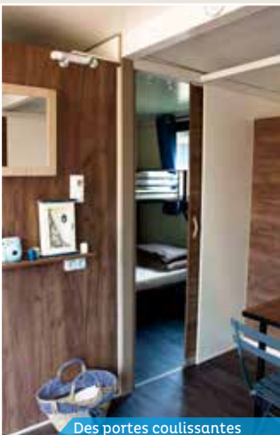
Des portes coulissantes