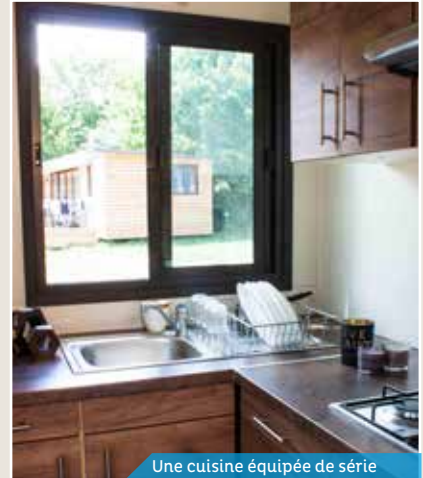
Une cuisine équipée de série